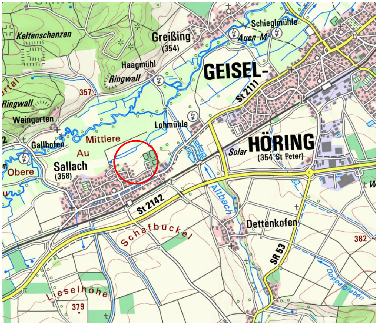
Abb. 1: Übersichtslageplan aus dem BayernAtlas vom 23.04.2025 – Maßstab 1:25.000