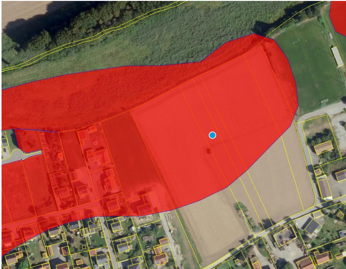
Abb. 4: Bodendenkmale (Auszug aus dem BayernAtlas) – ohne Maßstab

D-2-7140-0167: Siedlung und Grabenwerk vor- und frühgeschichtlicher Zeitstellung sowie Siedlung und Brandgräberfeld der späten Bronze- und der Urnenfelderzeit. Siedlung der römischen Kaiserzeit/Völkerwanderungszeit.