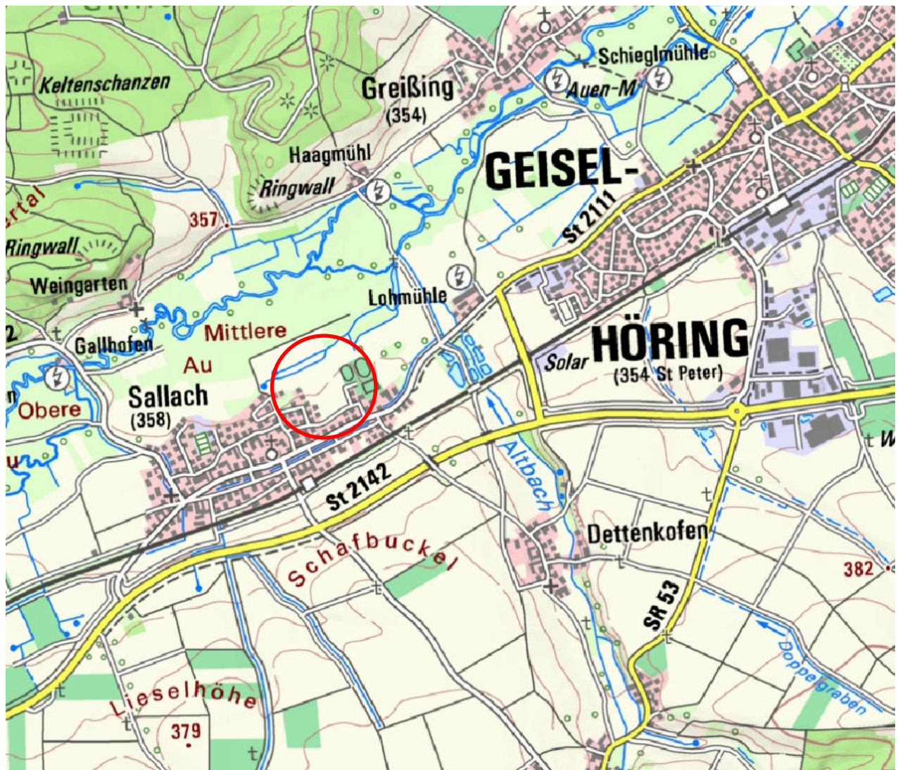
Abb. 1: Übersichtslageplan aus dem BayernAtlas vom 23.04.2025 – Maßstab 1:25.000