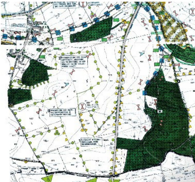
Abbildung 2: Ausschnitt aus dem rechtskräftigen Landschaftsplan der Stadt Geiselhöring

Der Landschaftsplan stellt den geplanten Modulbereich als Fläche für die Landwirtschaft dar. Der Flächennutzungsplan wird im Parallelverfahren durch Deckblatt Nr. 32 geändert.