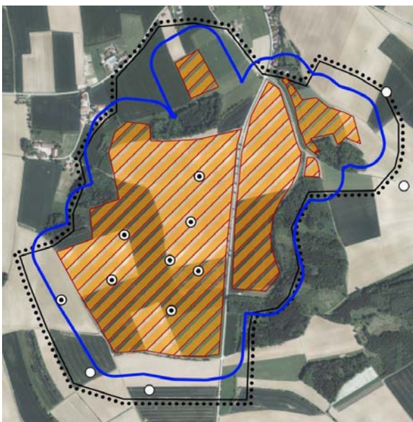
Fundorte Brutreviere der Feldlerche lt. sAP

An den Rändern der Gehölze gibt es einige Reviere der Goldammer. Die Gehölzränder sollten daher bei dem Bau nicht beeinträchtigt werden.