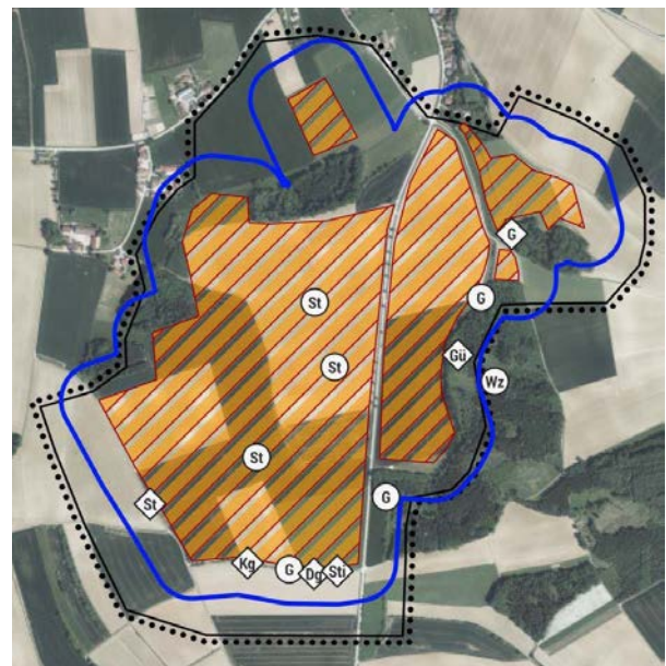
Fundorte Brutreviere weiterer Vogelarten lt. sAP